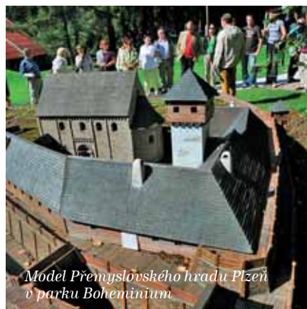
Model Přemyslovského hradu Plzeň v parku Bohemínium

stěží vyslovili, pokud se však vrátíme o tisíc let zpátky, do přelomu 10. a 11. stol., Stará Plzeň i knížecí centrum v Praze vykazují řadu pozoruhodných paralel. Možná již hledáním vhodného místa k založení mocenského střediska na západě Čech tehdejší lokátoři rozpoznali v táhlé ostrožně nad řekou Úslavou podobnost s polohou, na které vznikl Pražský hrad. Na jihu se hradiště prudce svažuje k řece, v Praze k Vltavě, tady k Úslavě. Ze severu je chrání údolí po-