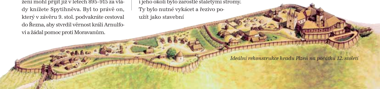
Ideální rekonstrukce hradu Plzeň na počátku 12. století

na dálkové cestě z Prahy do Bavorska řadila hrad Plzeň mezi nejvýznamnější